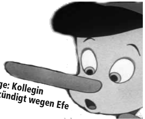
Lüge: Kollegin gekündigt wegen Efe

Wenn Daimler in Marienfelde Jobs vernichten will, dann ändern sich auch die Charaktere der E4er. So muss wohl das Verhalten des E4er in Bau 24 verstanden werden: Er setzt alles daran, kritische Betriebsratsarbeit zu verhindern.